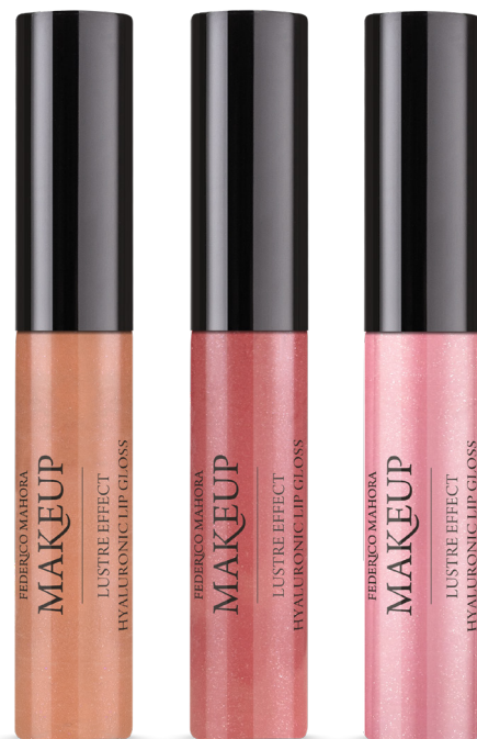
CLASSY LADY RASPBERRY KISS UNICORN DUST