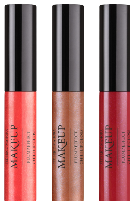
CANDY FLOSS GOLDEN SHINE VERY CHERRY

Нанесіть рівномірно на губи. Може мати ніжний ефект поколювання.